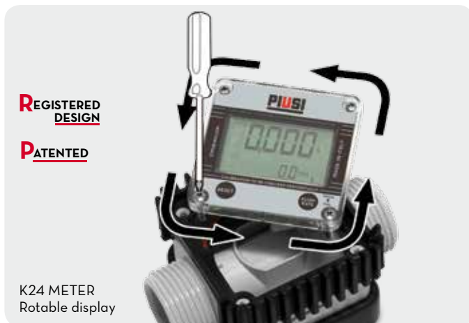
K24 METER Rotable display